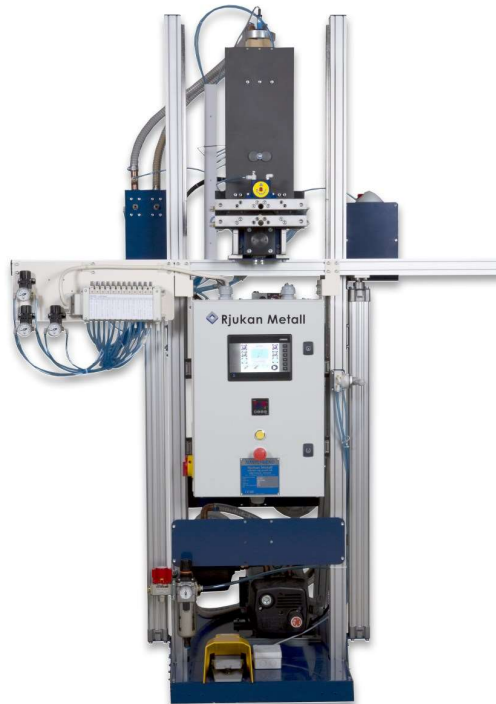
Llenadora de tamiz DF102